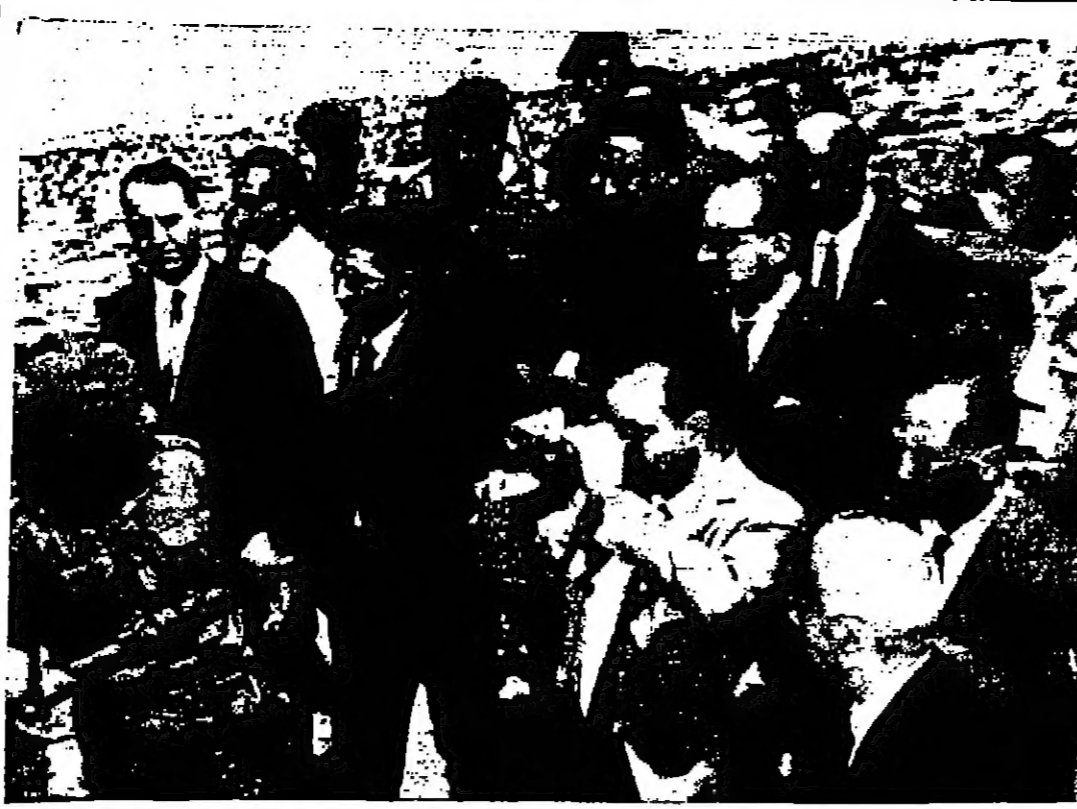
امير عبد الحميد الفيحاء ورئيس وزراء ليبيا اثناء زيارته لعمان في الخطوط الاممية